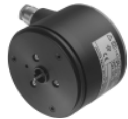
KINAX WT 710

= -40 \text{ °C} \dots +75 \text{ °C T5}