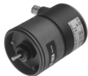
KINAX WT 710 mit Zusatzgetriebe